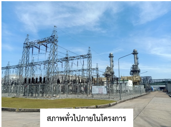
สภาพทั่วไปภายในโครงการ