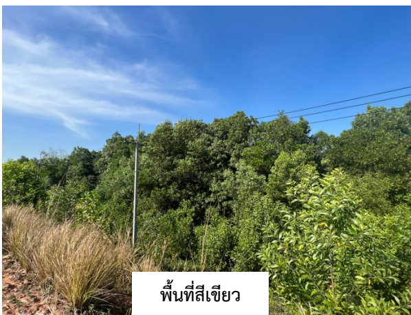
พื้นที่สีเขียว