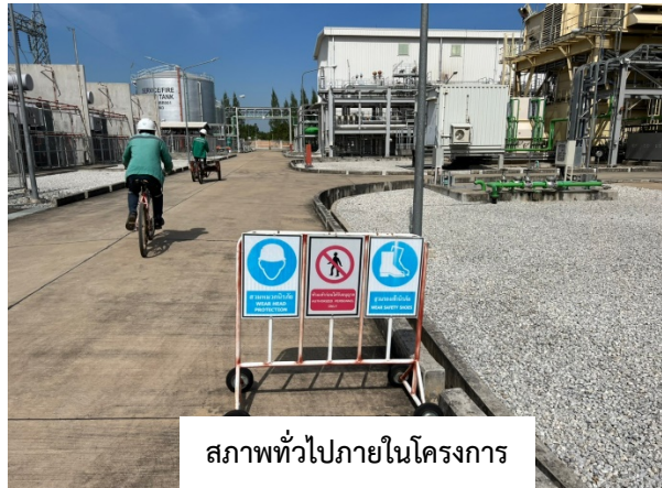
สภาพทั่วไปภายในโครงการ