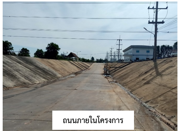
ถนนภายในโครงการ