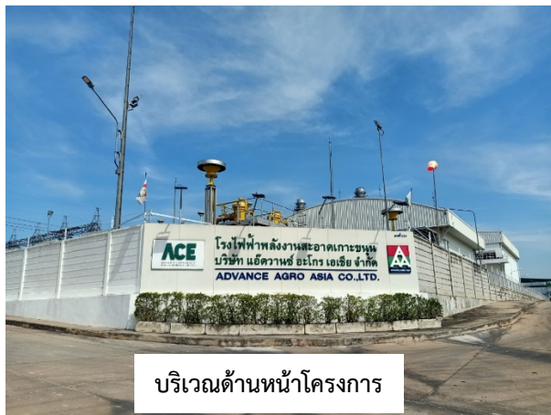
บริเวณด้านหน้าโครงการ