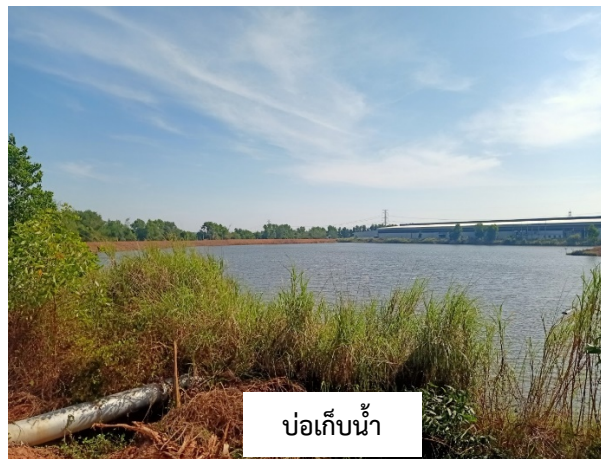
บ่อเก็บน้ำ